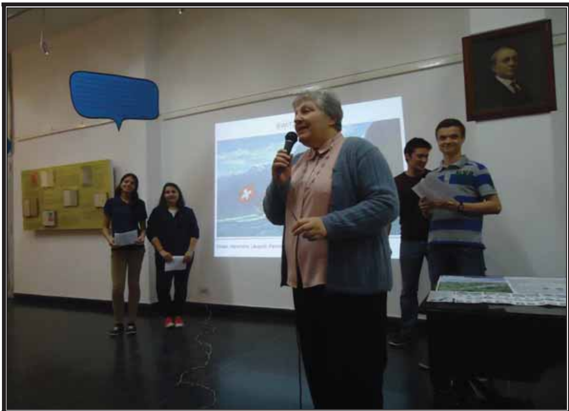
La presidenta del Centro Valesano anuncia la charla de los estudiantes.