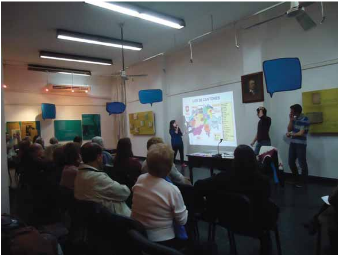
Alizée presenta los cantones de Suiza. Vista parcial del público.