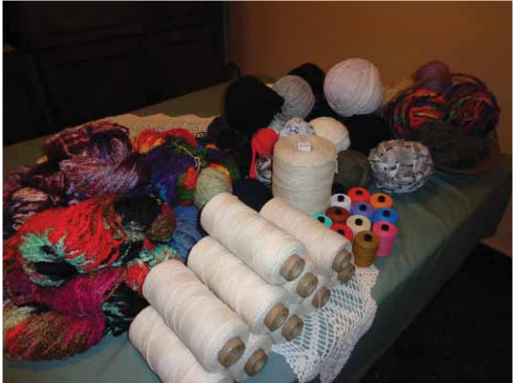
Materiales donados para el Taller de Tejido de la Escuela N° 504 (Tigre)