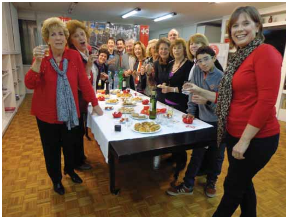
Lunch ofrecido a los socios después de la Asamblea