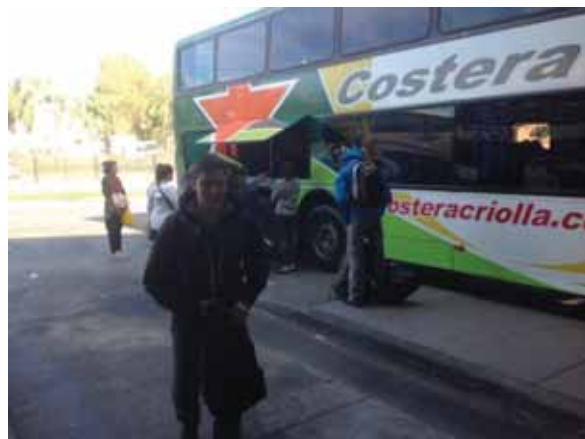
Llegada a Rosario desde Paraná.