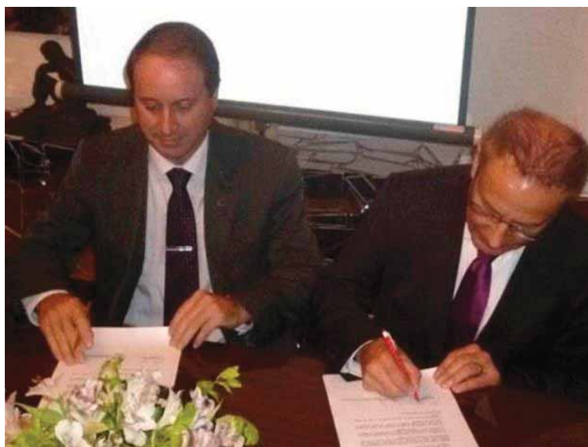
Acuerdo. El intendente Bolatti y el embajador Matyassy, firmando el contrato.

Una comitiva de la Embajada de Suiza visitó las obras sustentables que ésta promueve en la ciudad a partir de un convenio cooperativo.