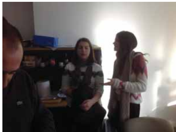
Primer día de asistencia a los lugares para realizar las pasantías.