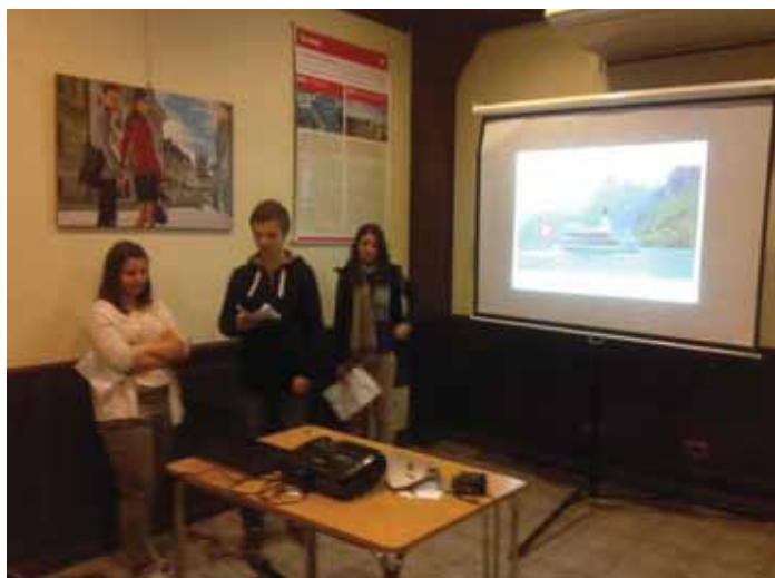
Durante la exposición sobre el sistema de salud de Suiza y su Facultad de medicina en Ginebra.