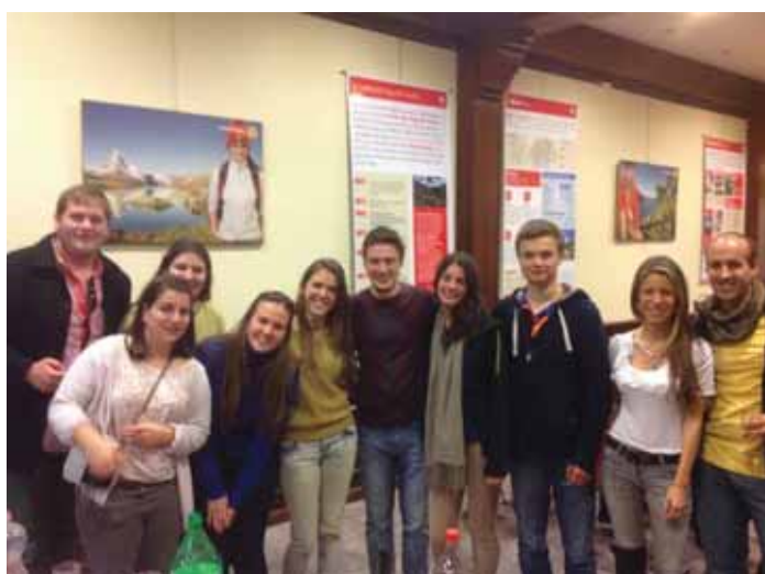
Los Chicos de Nuestra Asociación con los pasantes