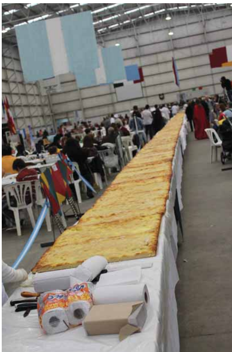
La torta 45,64 mts de largo por 0,70 mts. de ancho