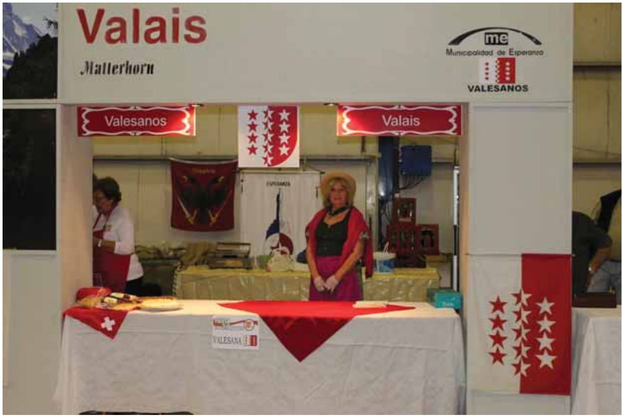
El stand de la Asociación