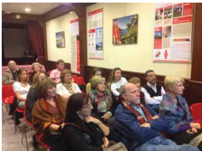
Asistentes a la conferencia