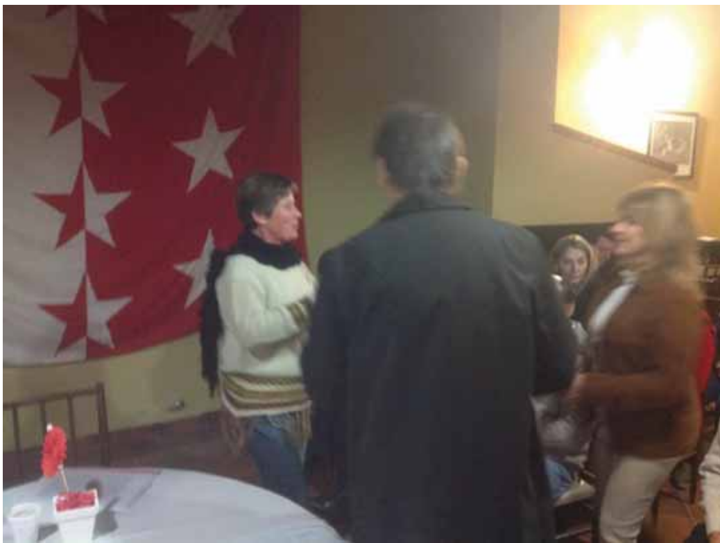
Intercambio de presentes