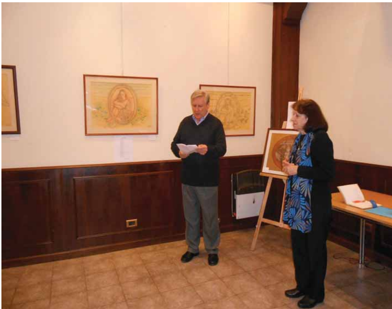
Presentación de la muestra.