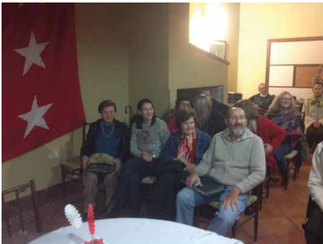
La intendenta de San Jose y Delegados