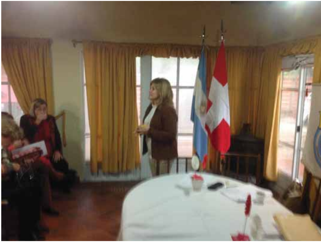
En nombre de San Jose nos dieron la bienvenida