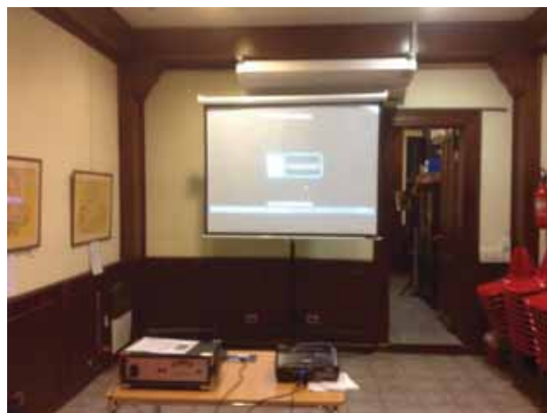
Presentación del film