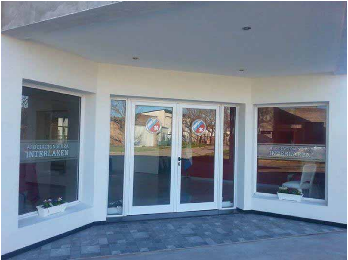
Frente de la Institución