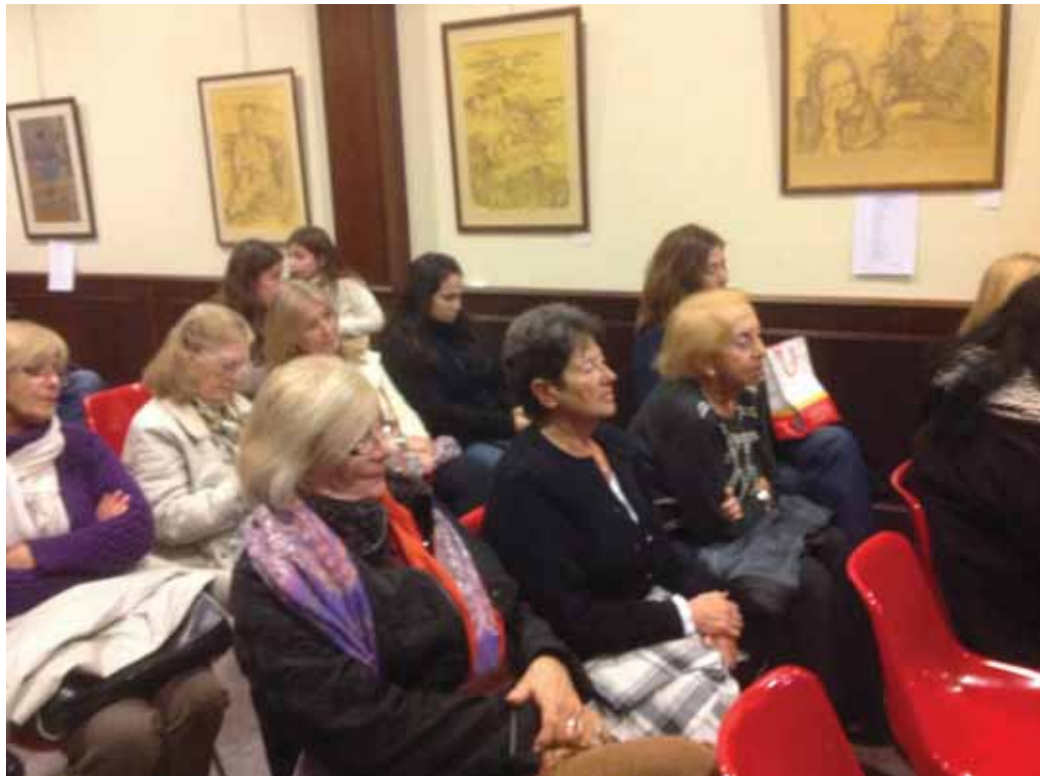
Asistentes a la Conferencia