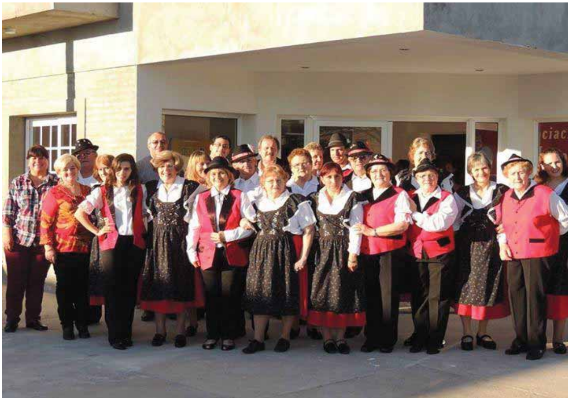
Cuerpo de baile de Mayores