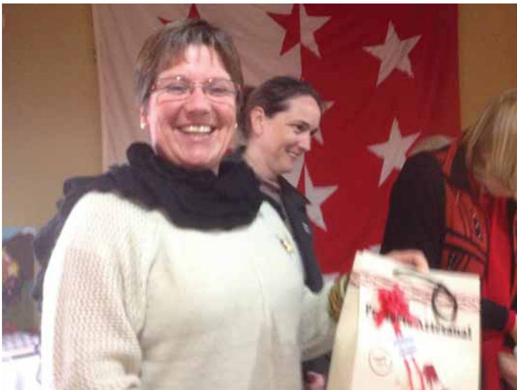
Presente de San Jose a EVA