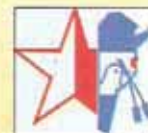
COLON (ENTRE RIOS)