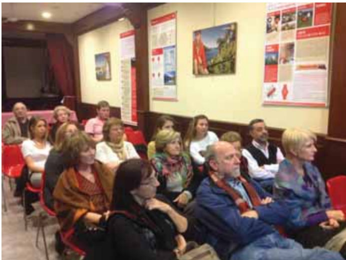
Asistentes a la conferencia