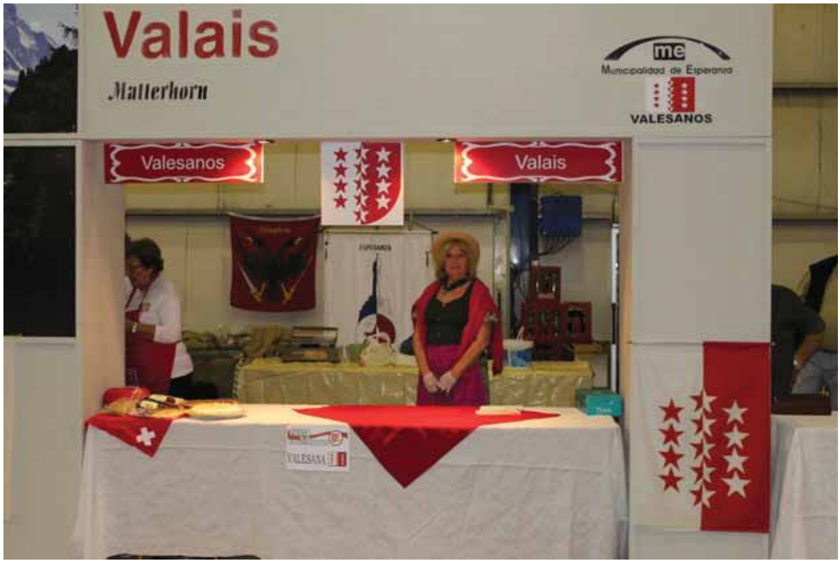
El stand de la Asociación