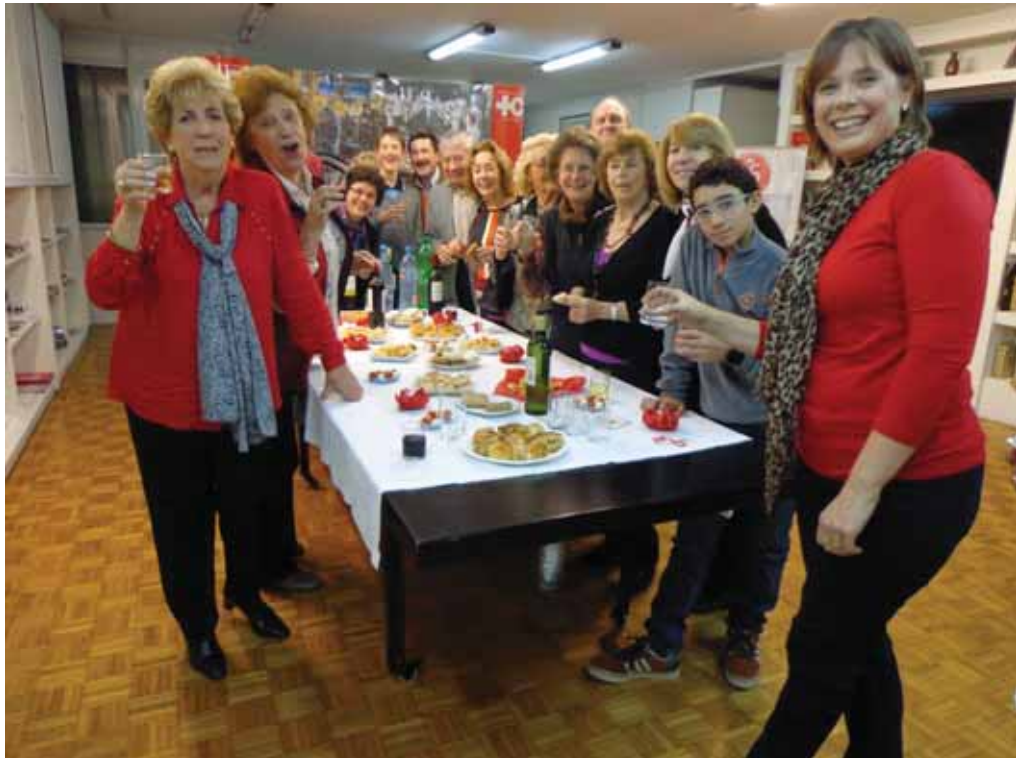
Lunch ofrecido a los socios después de la Asamblea