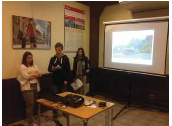
Durante la exposición sobre el sistema de salud de Suiza y su Facultad de medicina en Ginebra.