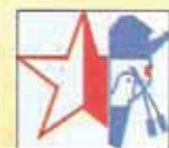
COLON (ENTRE RIOS)