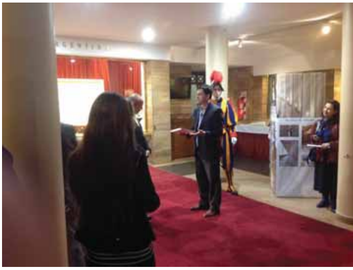
Presente de la Embajada para la Municipalidad