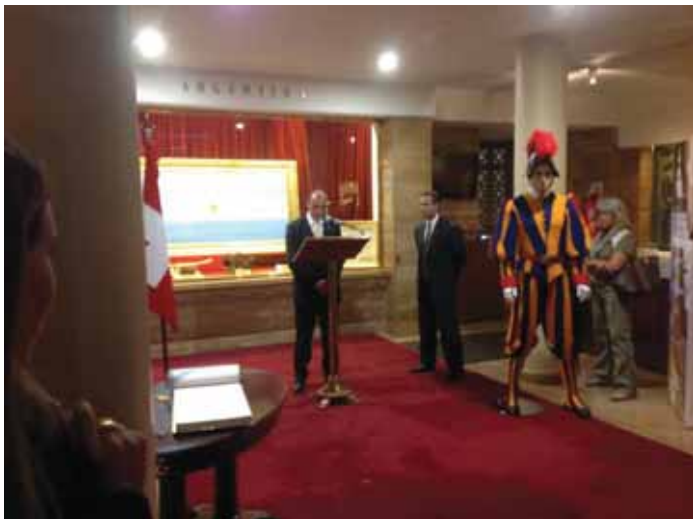
Palabras del Cónsul general de Suiza