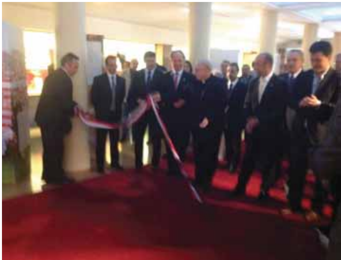
Corte de la cinta inaugurando la muestra.