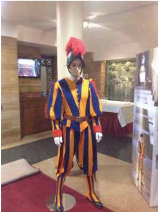
Paneles de la muestra y vitrinas expuestas.