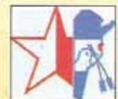
COLON (ENTRE RIOS)