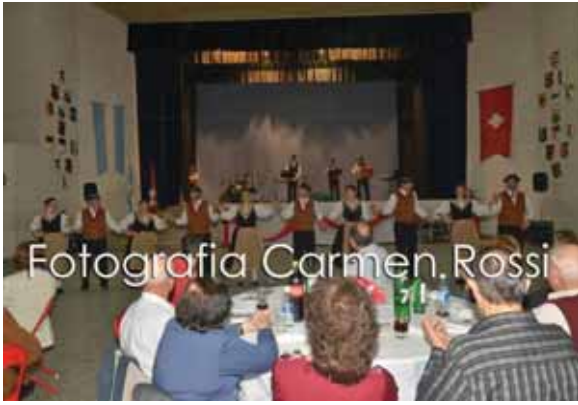
Fotografia Carmen Rossi